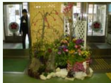
東住吉区役所・南部方面と合同作